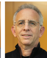
GUSTAVO GROISMAN Locarno